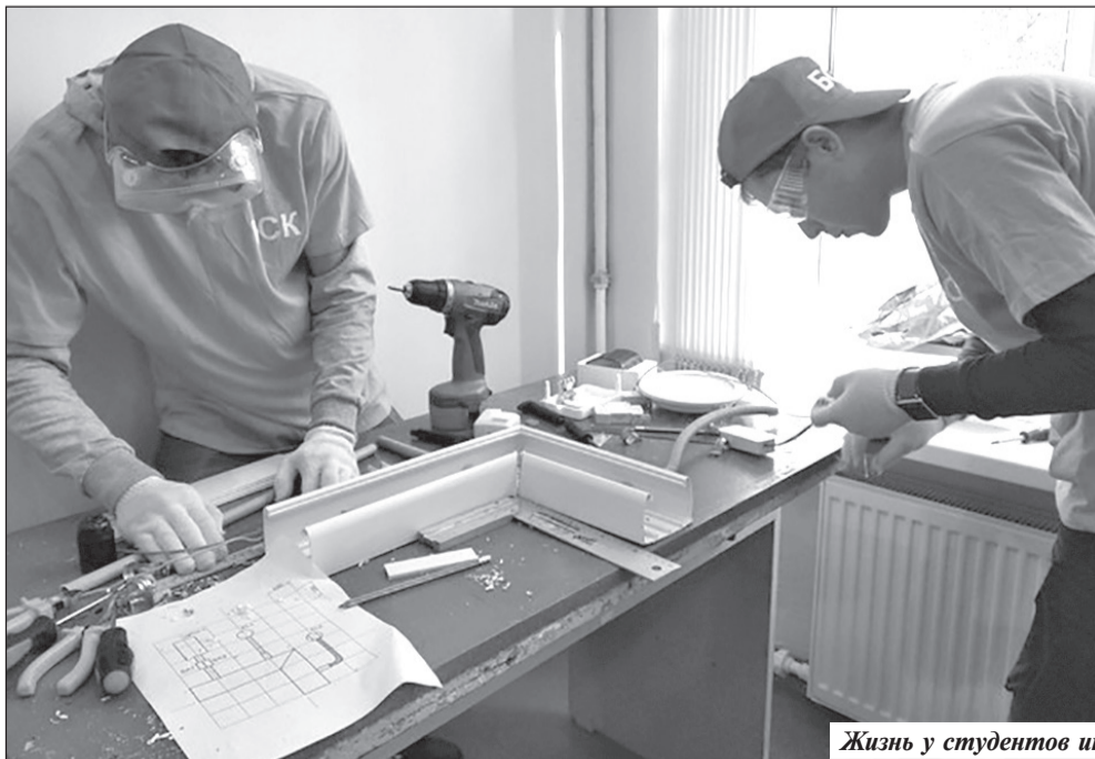
Жизнь у студентов интересная и насыщенная.

– Найти свой путь и прожить яркую, достойную жизнь. Если вы на распутье – приходите к нам за современной перспективной профессией и насыщенными положительными эмоциями учебными буднями! Добро пожаловать!