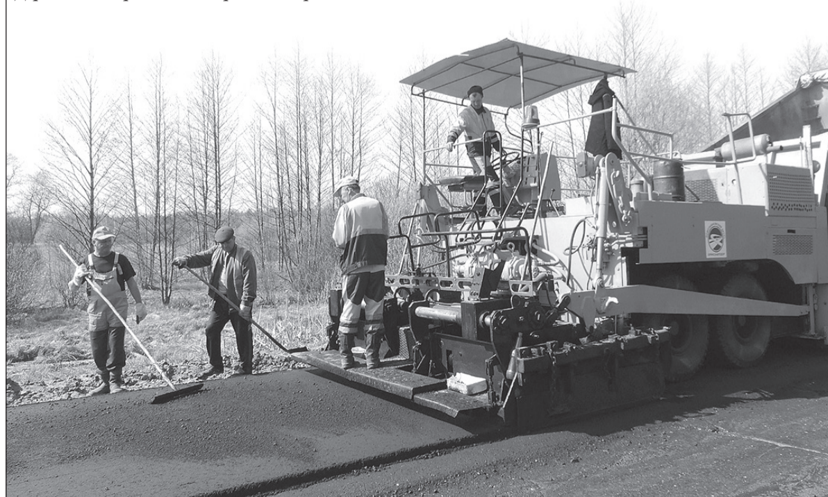
Дорожники за работой в Карачевском районе.