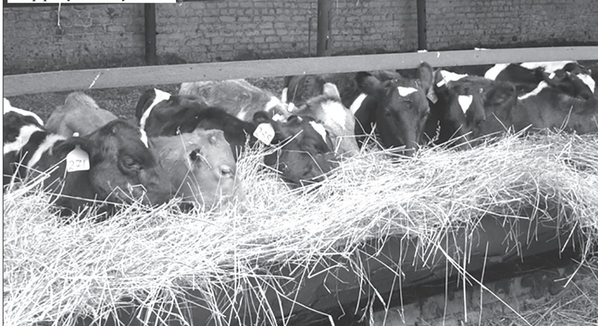
На ферме у Елены Куликовой.