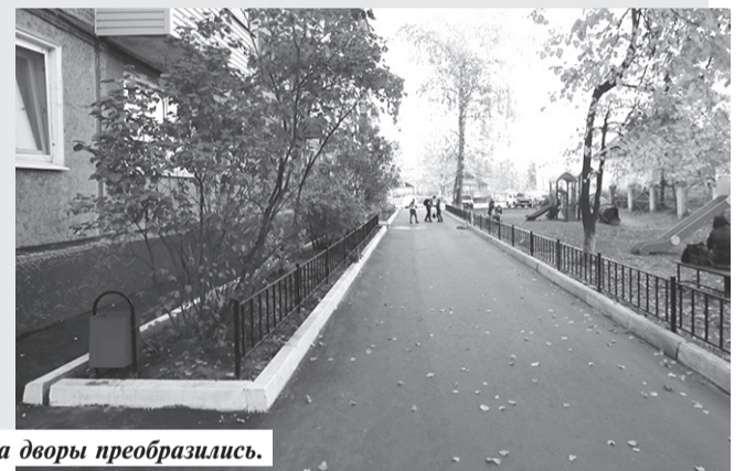
После благоустройства дворы преобразились.